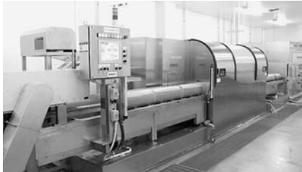
食品用の超高压処理装置

超高压処理は食品を非加熱殺菌できることから、近年ニーズが高まっている。桃浦なま生産者同会(宮城県石巻市)は、神戸製鋼所などと共同で、自動殺菌機「かき超高压処理装置」を昨年11月から開始し、加工業者や小売段階で、搬送期間を延長する用途への利用が期待できる。旨味、風味、消費期限を延長されれば、加工業者や小売段階で、搬送期間を延長する用途への利用が期待できる。